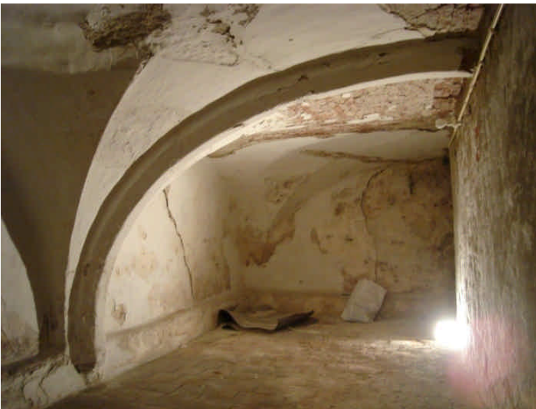
foto2: richting trap