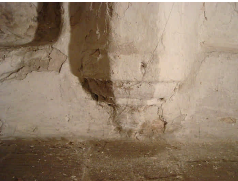
foto3: console van boog