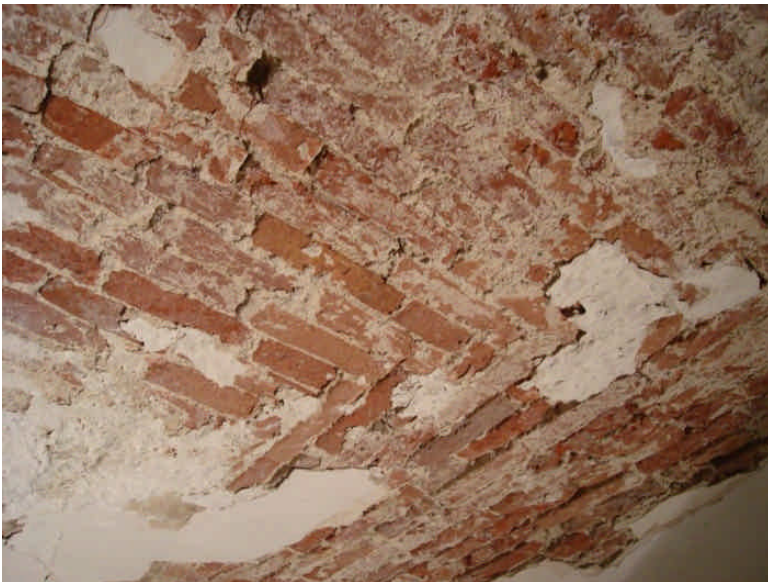
foto5: stenen in het plafond