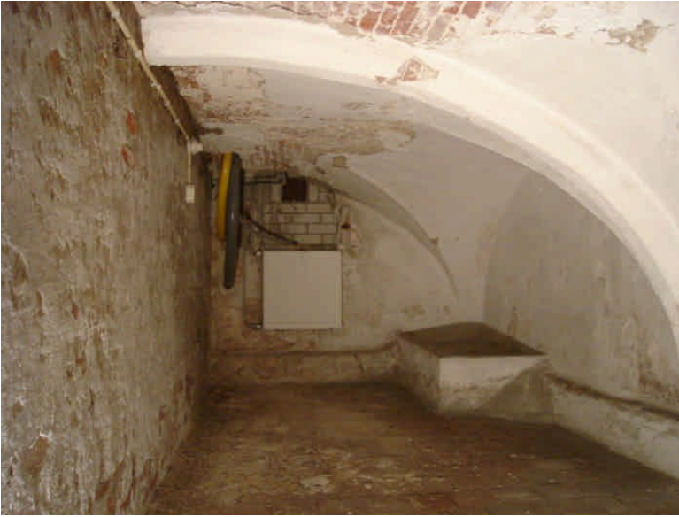
foto1: richting Rijnstraat